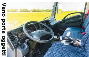
Vano porta oggetti