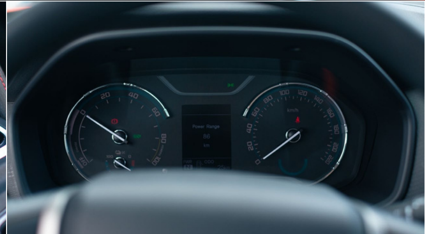
Quadro strumenti con display multifunzione