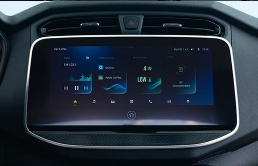
Smart Audio System da 10,25" Touch, con CarPlay& QD Link