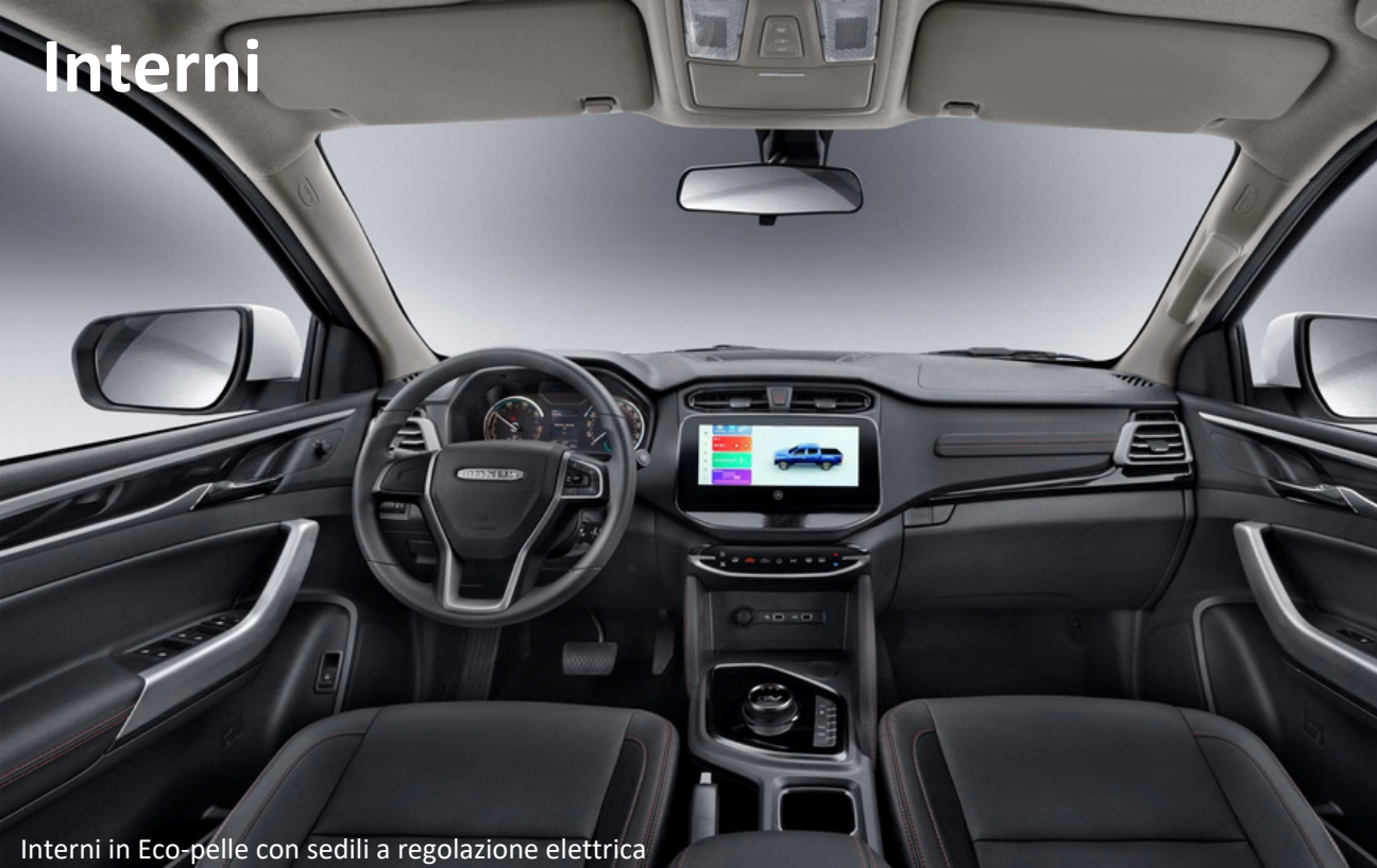
Interni in Eco-pelle con sedili a regolazione elettrica