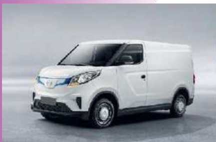
BIANCO DI SERIE

Maxus eDELIVER 3 è disponibile in due versioni, passo corto (SW) e passo lungo (LW). La versione a passo corto (SW) ha una lunghezza massima del vano di carico di 2.180 mm e volume di carico pari a 4,8 m 3 . La versione a passo lungo (LW) offre invece un vano di carico con una lunghezza di 2.770 mm e volume di carico di 6,3 m 3 .