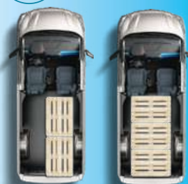
PASSO LUNGO (LWB)

Immagini a scopo illustrativo. Le dotazioni e gli equipaggiamenti possono variare a seconda dei mercati. Maggiori dettagli presso le concessionarie.