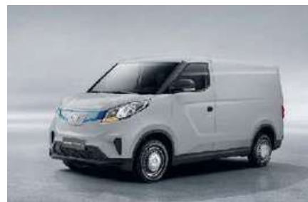
GRIGIO METALLIZZATO OPTIONAL