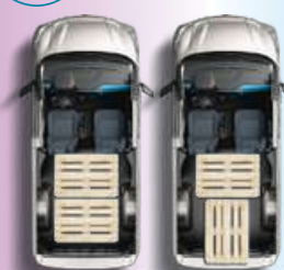
PASSO CORTO (SWB)