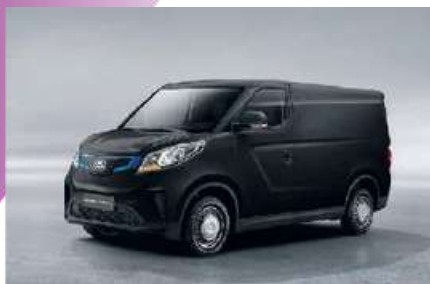
NERO METALLIZZATO OPTIONAL